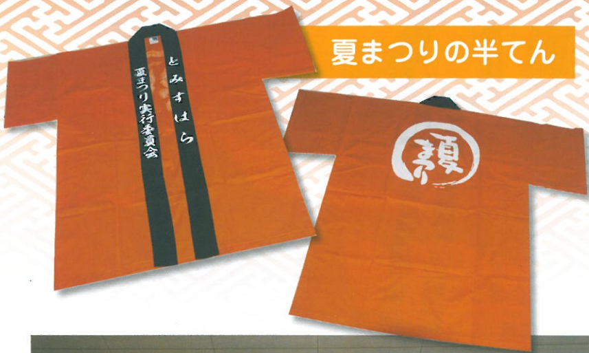
夏まつりの半てん