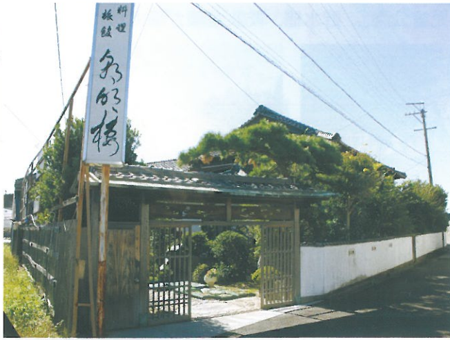
朝明楼（天力須賀地区）

創業82年（昭和12年）で、当時は料理旅館を営んでいましたが、現在は飲食のみ行っています。