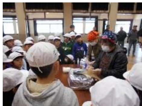
アルファ米の炊き出し

富洲原小学校講堂で、4年生の全クラスと各町の自主防災隊長が合同研修を実施しました。 アルファ米の炊き出しをはじめ、消防分団の指導による放水体験、自主防災隊による簡易トイレ・テントの組立体験、担架と毛布を用いた救護体験など災害発生時に役立つ内容で、子どもたちにとって大変貴重な学習の機会になりました。