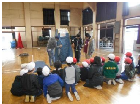
簡易テントの組み立て