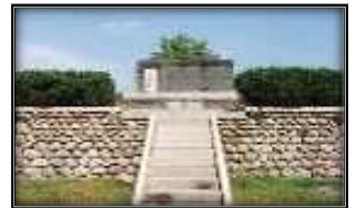
伊勢湾台風殉難慰霊碑