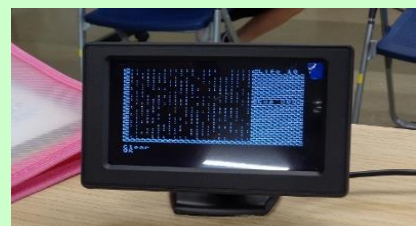
プログラミングで作ったゲーム