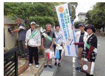
今年は、松原地区で啓発活動をされました(7/3)