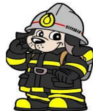
四日市市北消防署

住宅用火災警報器は、消防法と四日市市火災予防条例により、設置が義務付けられていますので、必ず設置しましょう。また定期的な点検も必ず行いましょう。